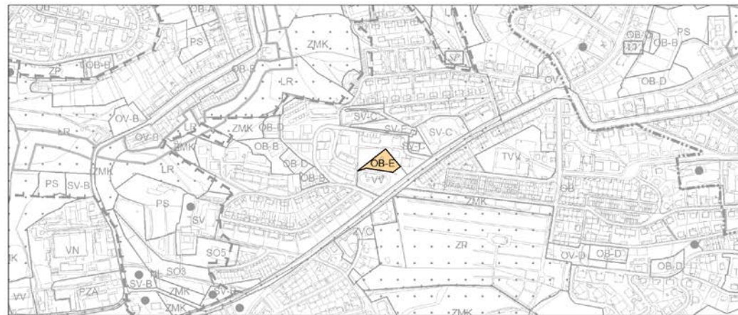
informativní zakres návrhu změny